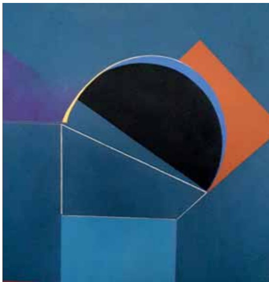
Met de steun van de Schepen van Franstalige Cultuur Jean-Louis Pirottin

In de jaren '80 stelt de kunstenaar zijn schilderijen tentoon tijdens groeps- en individuele expos's. Nu hij met pensioen is, en onder impuls van zijn naasten, treedt hij opnieuw naar buiten met