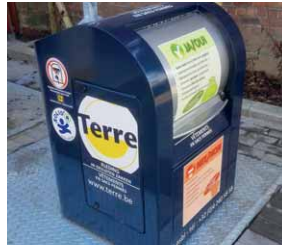
Een initiatief van de Schepen voor Openbare reinheid Geoffrey Lepers

Opgelet, in een kledingcontainer horen enkel propere kleren en huislinnen, lederwaren (tassen, portefeuilles,...) en schoenen, samengebonden per paar.